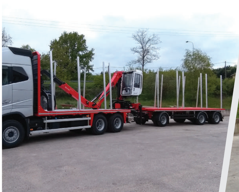
Exemple de REMORQUE PLATEAU PALFINGER avec 6 cages à ranchers par côté, 4 cages à l'avant et 4 cages à l'arrière