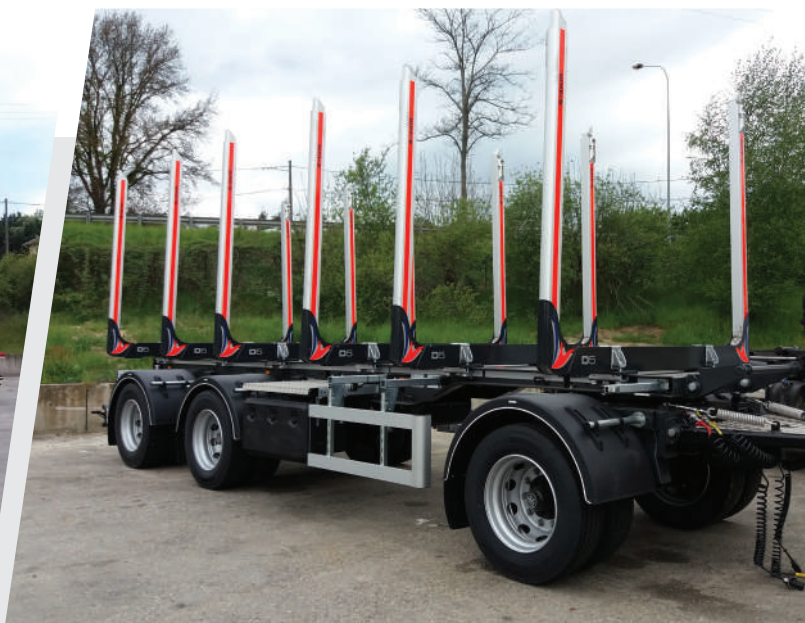
Exemple de REMORQUE PALFINGER BERCES avec 6 berces EXTE D5 télescopiques