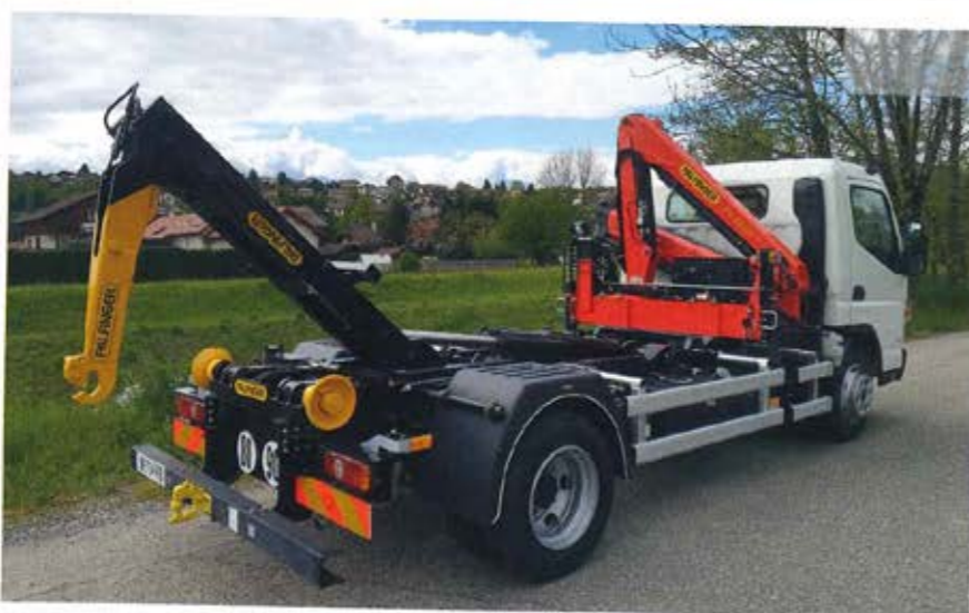
Le groupe Vincent Palfinger est un spécialiste des « petits chantiers ». Son bras polybanne « City » est apprécié pour son rapport poids-puissance.