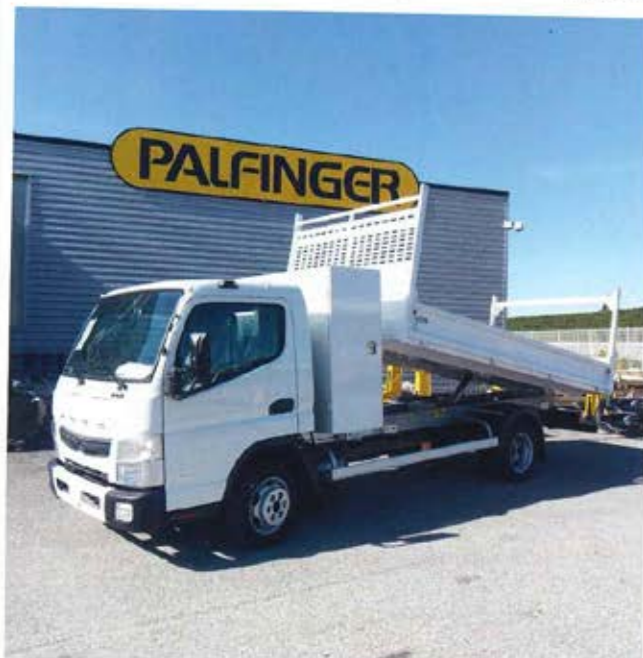
Les bennes RCI signée par le groupe Vincent sont reconnues pour leur grande robustesse.

Klubb Group est le n°1 de la nacelle élévatrice sur porteur et propose des solutions éco-responsables à ses clients : avec la KL 26 sur Iveco GNV, les économies de carburant sont importantes.