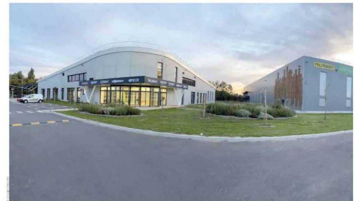
btp construction N° 356

l'environnement, 1250 grues auxiliaires Palfinger et 1150 bras Palfinger. Chez Sygmat, on dénombre près de 1 000 matériels suivis. Les grues de chantiers non routières s'octroient 40% PDM, tandis que les pelles de manutention issues de la gamme lourde concentrent 35 % PDM.